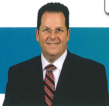
Mayor Brian P. Stack