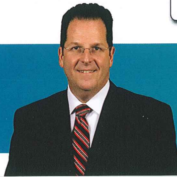
Alcalde Brian P. Stack